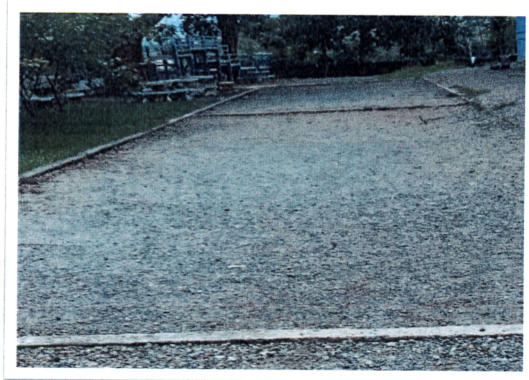
12. บริเวณลานกิจกรรม (ตะกร้อ ,วอลเลย์ ฯลฯ)