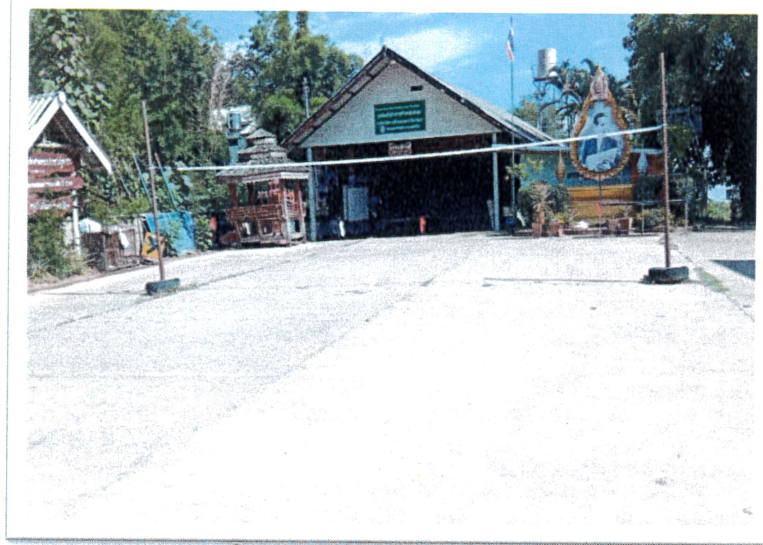
11. บริเวณลานกิจกรรม (กีฬาเปตอง)