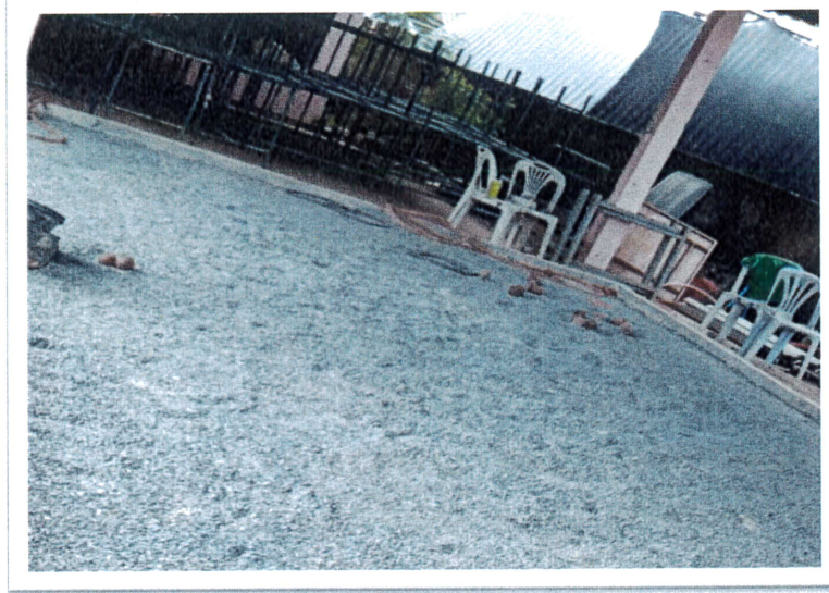
อุปกรณ์กีฬา เทสบอลตำบลนางแล

บ้านใหม่นางแล หมู่ที่ 17 ตำบลนางแล อำเภอเมืองเชียงราย จังหวัดเชียงราย